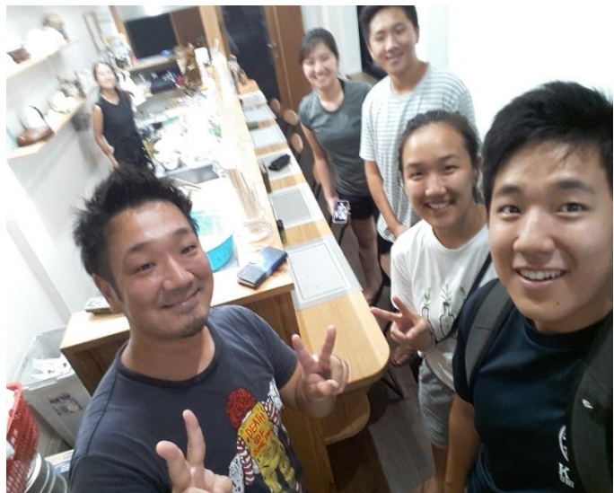
Karaage man! A local restaurant owner that fed us quite often.

haven't been able to have any really good conversations because of the time difference. Thinking back too everything that happened during my time in Japan, I think the most amazing thing had to be my time with the Lord. Going in to the trip I prayed that I would be able to rely on God more in my life. God really answered my prayers because there were so many things I really needed to lift up to him during the mission. One of the major takeaways I got from the trip were to believe the best, expect nothing, and love with everything. That is to believe the best of my brothers and sisters intentions, expect nothing from them, instead choosing to love them with everything in self-sacrifice. Some other things that I took back with me were journaling and improving in empathy. International missions is something that I highly recommend to everyone. You don't need this huge permanent calling to go to these countries. All that is needed is a little faith.